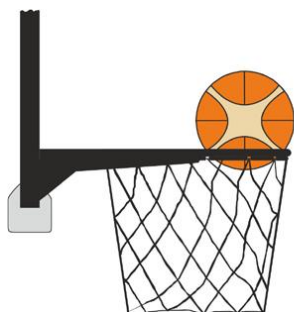
Figure 3 : Ballon dans le panier

Il y a violation pour intervention illégale si un joueur défenseur touche le ballon quand il est dans le panier.