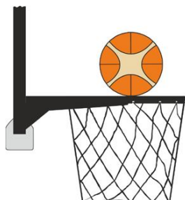
Figure 2 : Ballon en contact avec l'anneau

Il y a intervention illégale par un joueur défenseur ou attaquant si, lors d'un tir au panier, un joueur touche le panier ou le panneau alors que le ballon est en contact avec l'anneau et qu'il a encore la possibilité de rentrer dans le panier.